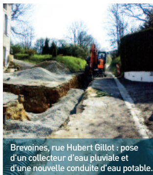
Brevoines, rue Hubert Gillot : pose d'un collecteur d'eau pluviale et d'une nouvelle conduite d'eau potable.