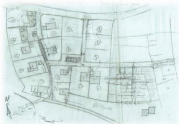
Esquisse des années 90/95